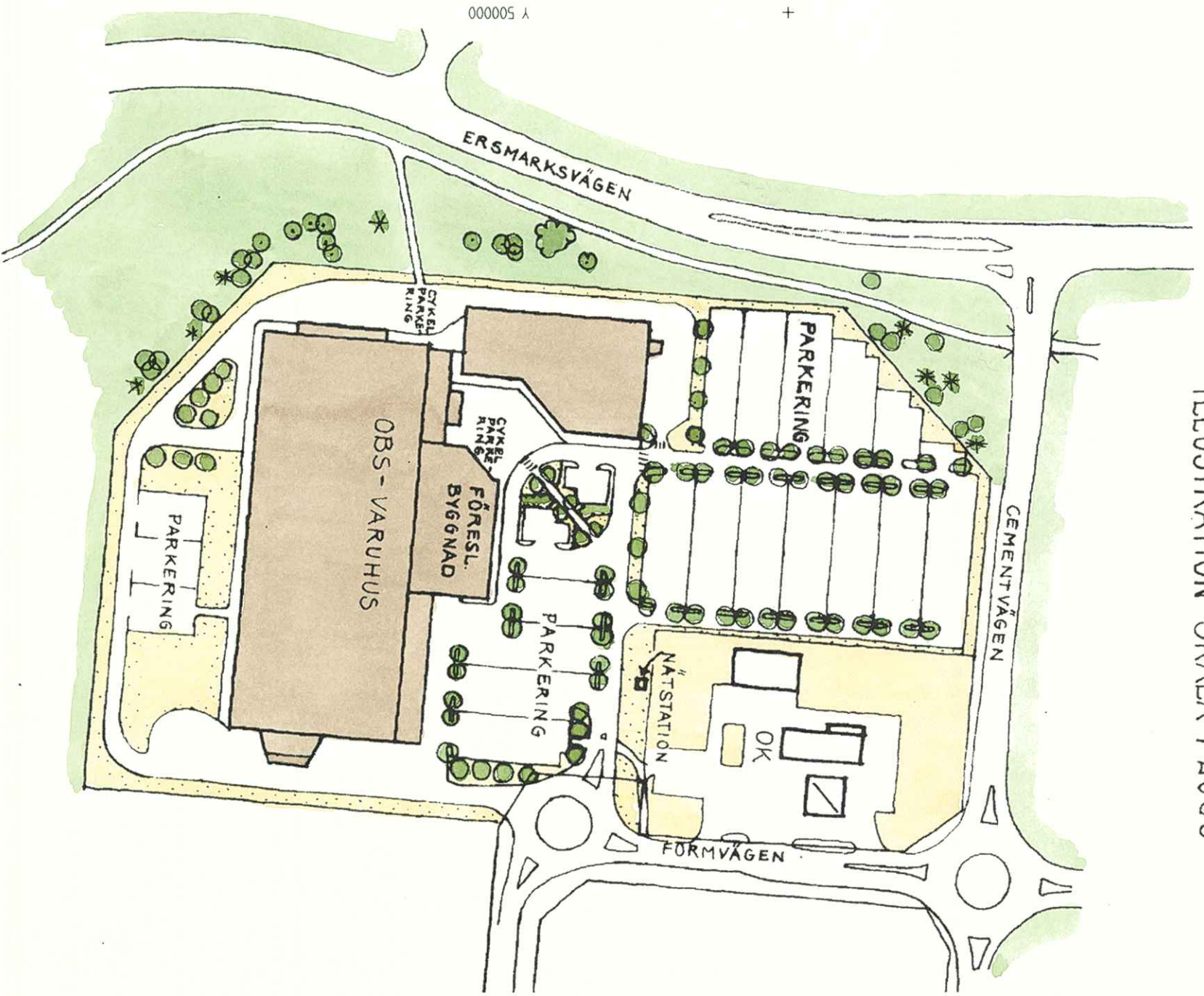
ILLUSTRATION SKALA 1:2000

PLANBESTÄMMELSER Följande gäller inom områden med nedanstående beteckningar. Där beteckning saknas gäller bestämmelsen inom hela planområdet. Endast angiven användning och utformning är tillåten.