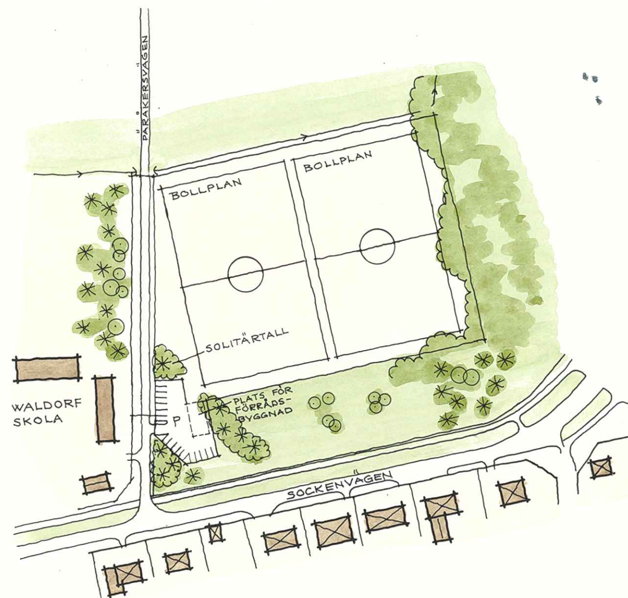
ILLUSTRATION SKALA 1:2000