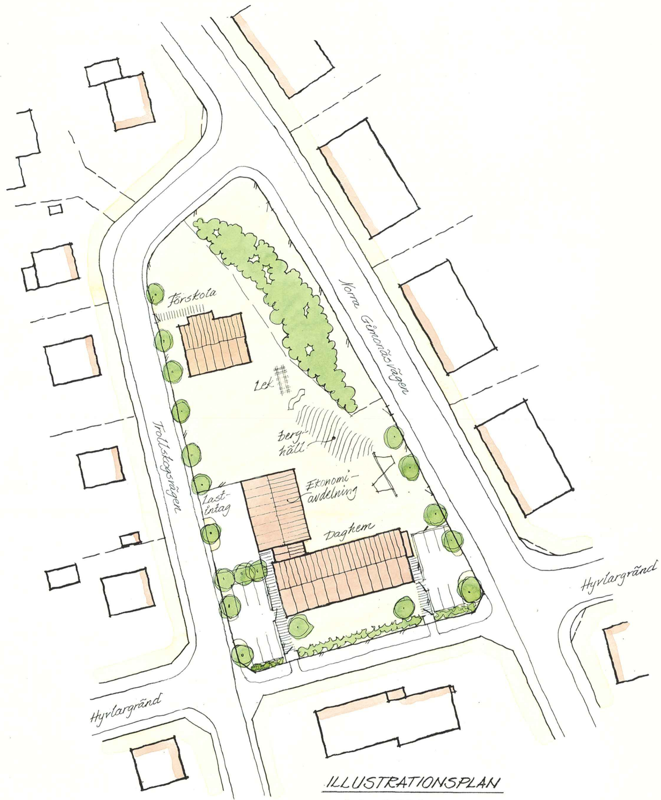
ILLUSTRATIONSPLAN skala 1:500

DETALJPLAN FÖR del av stg 2069 INOM SOFIEHEM I UMEÅ KOMMUN, VÄSTERBOTTENS LÄN