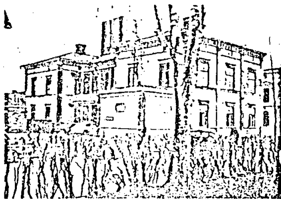
BYGGNAD NR 1: GÅRDSFASAD

2 vån med låg vindsvån. Korta flyglar mot gården med snickeriveranda i två vån (från 1899). Cementerad stensockel, timmerstomme. Panel med indelning i pilastrar och listverk. Vägghävt med beige locklistpanel, snickeridetaljer olivgröna. Konsolfris. Skyltfönster senare. Valmat rött plåttak.