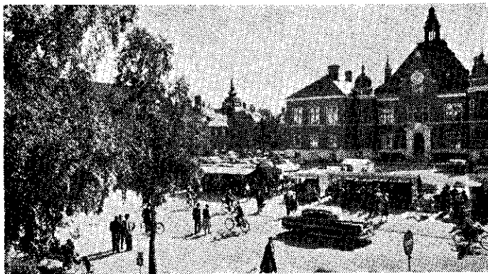
Rådhusorget en solig dag med färggranna salustånd och livlig trafik.